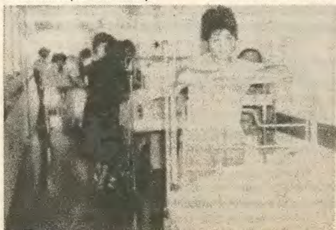
Εγχειρισμένα παιδια ριγμένα στους διαδρόμους. Απο το χάος των Νοσοκομείων.

που επικαλείται η κυβέρνηση δεν ευσταθούν. Ο καθένας σ' αυτο τον τόπο ξέρει πως κατασπαταλούνται εκατομμύρια είτε σε «ατυχείς» επενδύσεις, είτε σε κλάδους δευτερεύουσας σημασίας, είτε γεμίζουν τες τράπεζες της Ελβετίας. Νά απο που πρέπει να πάρει τα λεφτα το κράτος, ώστε να αυξήσει τες δαπάνες στην υγεία με την ανέγερση νέων, άρτια εξοπλισμένων νοσοκομειακών μονάδων.